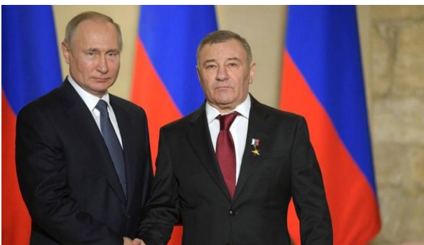
Wladimir Putin und Arkadij Rotenberg

Und Arkadij Rotenberg konnte die Ruine ersteigern. Na vielleicht hat er sich das Geld beim „Milliardär Putin“ ausgeliehen? Aber er soll ja selbst mehr Geld als genug besitzen.